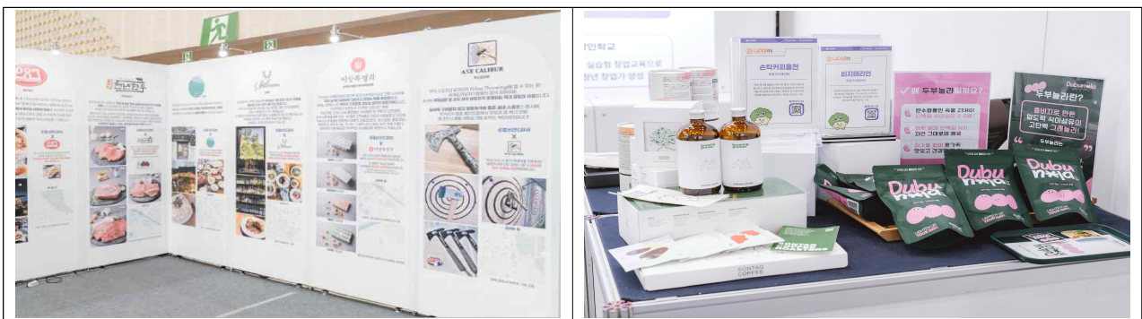
<예시사진 - 아트월 홍보(좌), 전시대 홍보(우)>